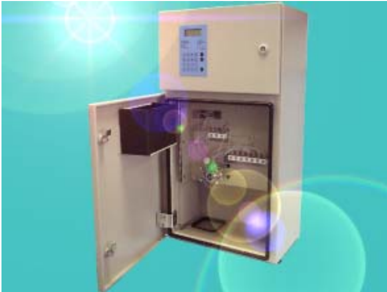
*LFA: Loop Flow Analysis, brevet en cours

MICROMAC Ammonia est un analyseur en ligne piloté par microprocesseur spécifiquement conçu pour la surveillance automatique de l'ammoniaque sur différents types de matrices aqueuses.